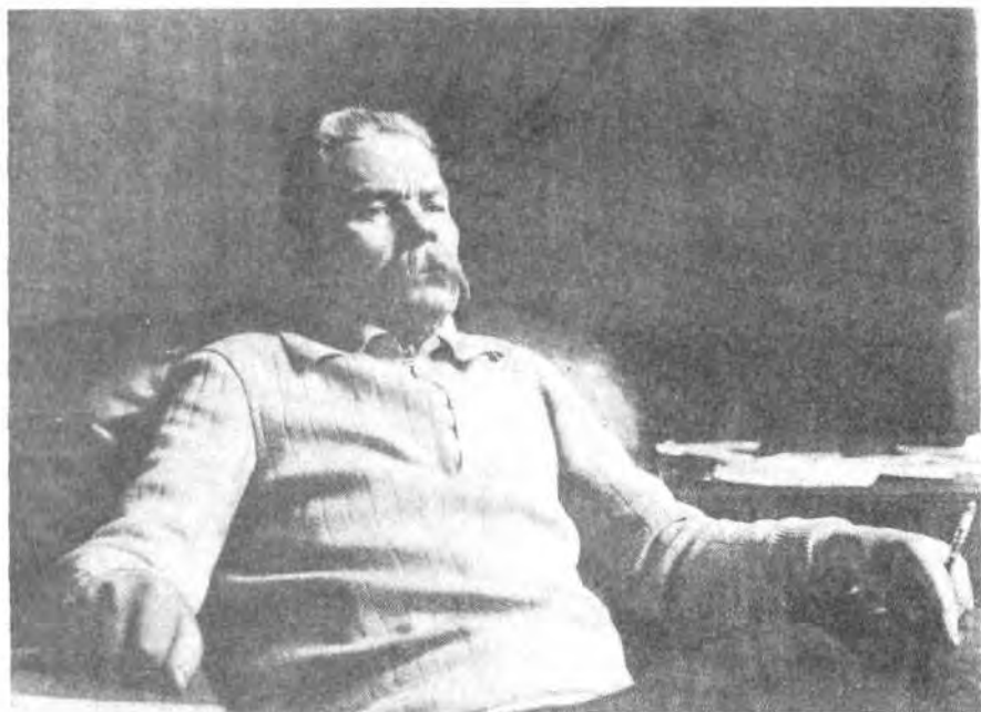
Р и с. 5. А. М. Горький в библиотеке на ул. Качалова. 1931.