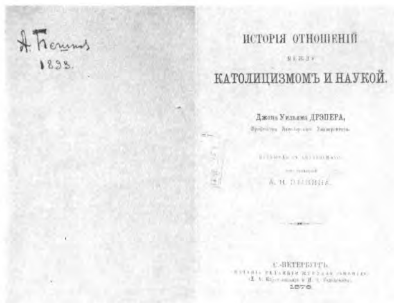
Р и с. 14. Дрэпер Д. У. История отношений между католицизмом и наукой. СПб., 1876. Титульный лист и форзац с надписью Горького

Рассуждения Горького о жизни человека, что представляет творчество из романтического как художественного, и как Будды Христа, Логоса, как фантастические романы.