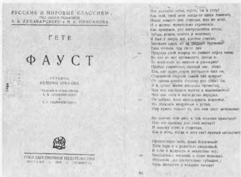
Р и с. 9. Гёте. Фауст. М.—Л., Госиздат, 1928. Титульный лист и стр. 94 с пометами Горького