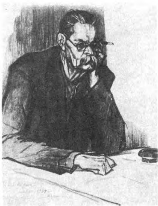
Р и с. 2. А. М. Горький. Ниж- ний Новгород. 1899.