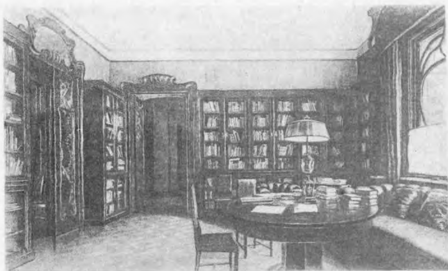
Р и с. 4. Библиотека А. М. Горького в доме на ул. Качалова. 1938. Художник А. Д. Корин