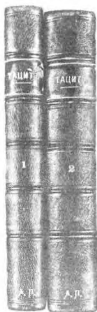
Р и с. 7. Тацит К. Сочинения. Т. 1, 2. СПб., изд. А. Ф. Пантелеева. 1886. Корешки книг с инициалами Горького