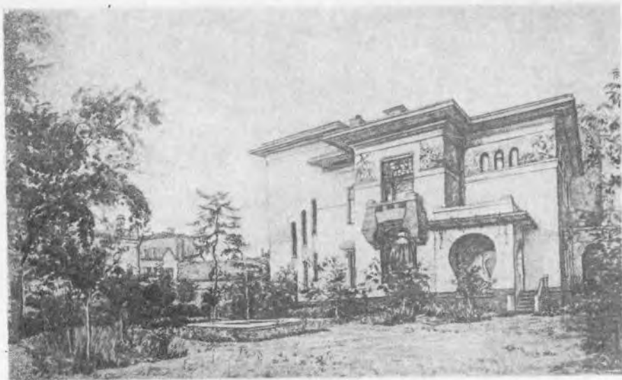
Р и с. 3. Дом, где жил А. М. Горький в 1931—1936 гг. (Москва, ул. Качалова, 6/2). Вид из сада. 1938. Художник А. Д. Корин