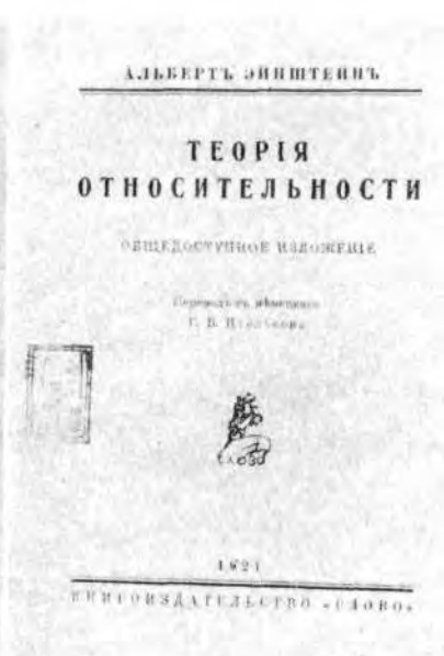
Р и с. 17. Эйнштейн А. Теория относительности. Берлин, кн-во Слово, 1921. Портрет автора и титульный лист